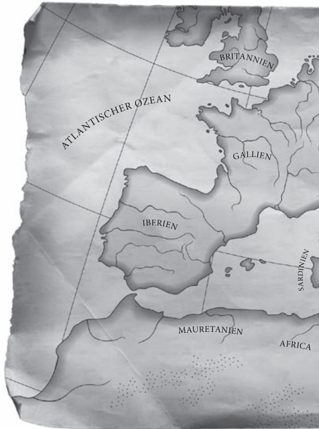
DAS RÖMISCHE REICH 117 N. CHR.